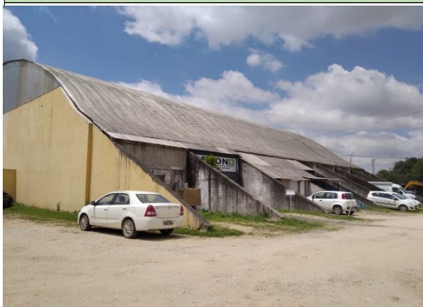
FOTO 3 - VISTA LATERAL ESQUERDA