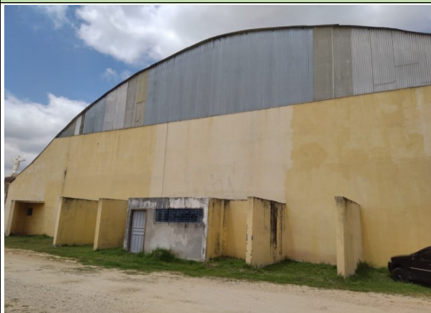
FOTO 4 - FUNDOS