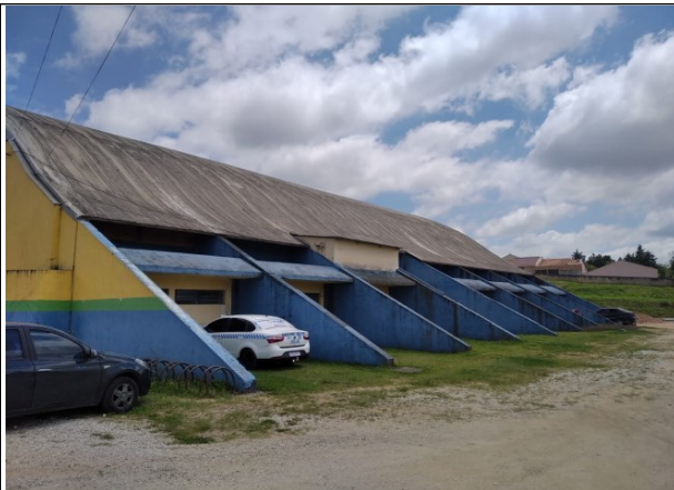
FOTO 2 - VISTA LATERAL DIREITA