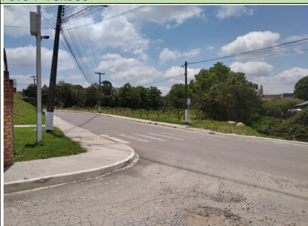
FOTO 6 - VIA DE ACESSO E ENTORNO