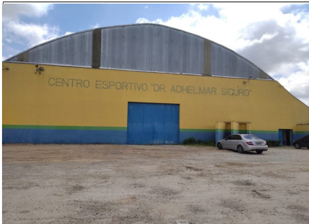
FOTO 1 - VISTA FRONTAL

Centro Esportivo (quadra de esportes/miniginásio)